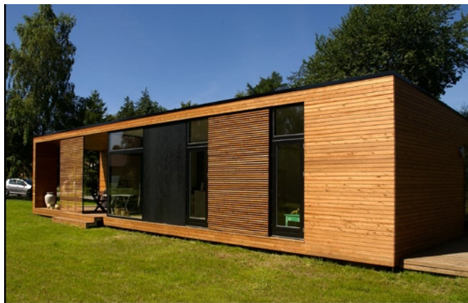
Det kan godt se sådan ud, men taget på ONV-huset er ikke fladt. Det har en såkaldt ensidig træhældning, hvor den side med køkkenrummet (billedet) er den højeste.