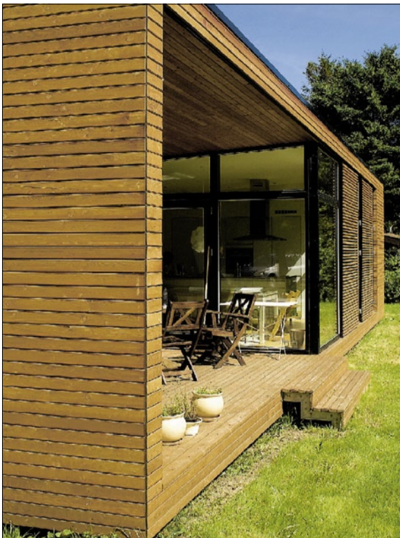
Træhuset har en overdækket sydøstvendt terrasse, som nærmest er bygget ind i selve »træklosets«, der udgør huset. På østsiden af huset er der en åben morgenterrasse.