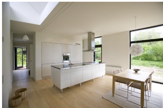
Masser af lys og meget lidt spildplads til f.eks. gangarealer kendetegner det lille hus.