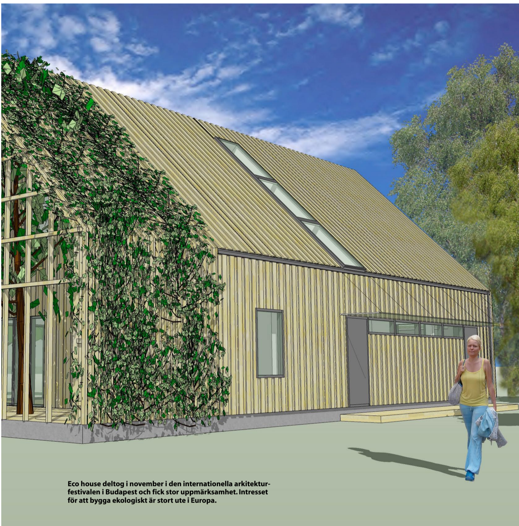
Eco house deltog i november i den internationella arkitekturfestivalen i Budapest och fick stor uppmärksamhet. Intresset för att bygga ekologiskt är stort ute i Europa.