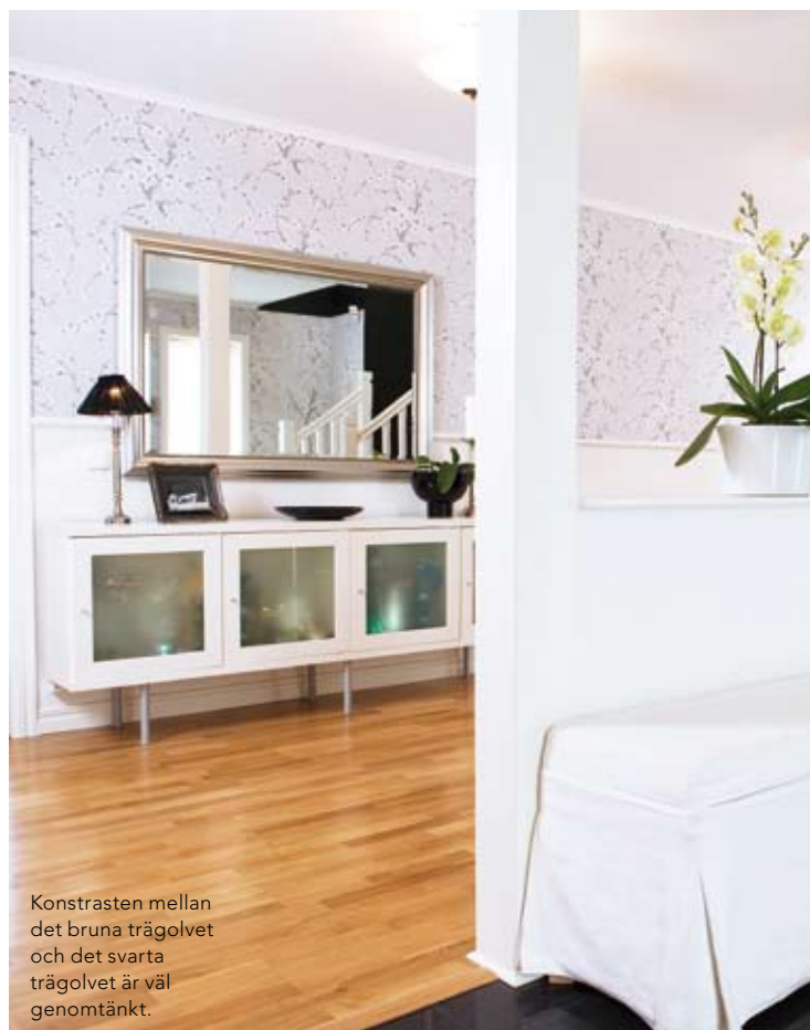
Kontrasten mellan det bruna trägolvet och det svarta trägolvet är väl genomtänkt.

Och så, plötsligt, uppenbarade sig en finurlig lösning. Genom att offra ▶