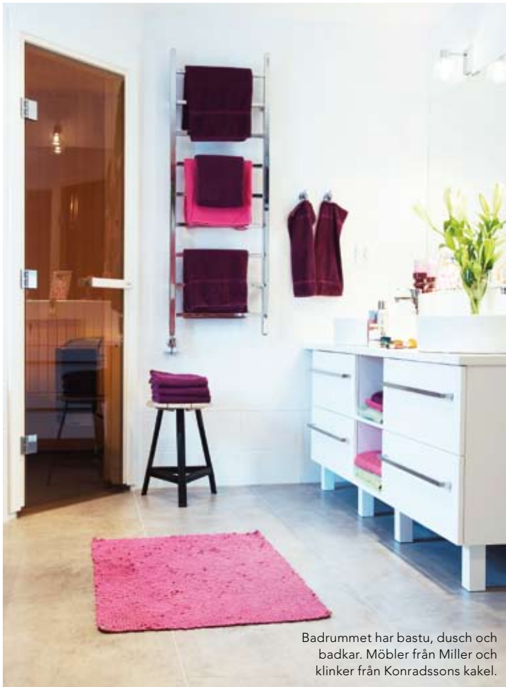
Badrummet har bastu, dusch och badkar. Möbler från Miller och klinker från Konradssons kakel.