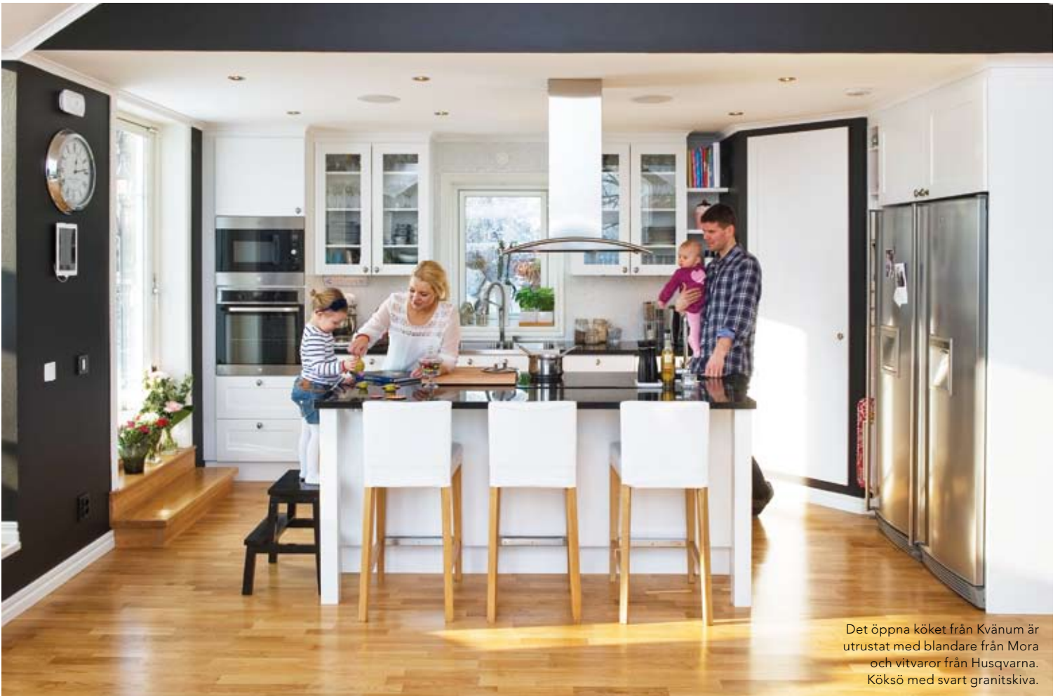
Det öppna köket från Kvånum är utrustat med blandare från Mora och vitvaror från Husqvarna. Köksö med svart granitskiva.