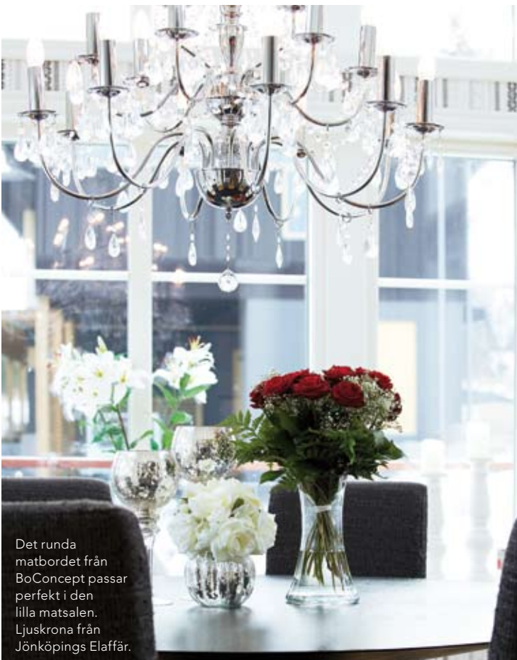
Det runda matbordet från BoConcept passar perfekt i den lilla matsalen. Ljuskröna från Jönköpings Elaffär.

I omnejden kring Jönköping ligger ett flertal attraktiva villaområden med ljuvlig vy över Vättern. På senare år har nybyggarna poppat upp här som svampar ur marken och områdena kring Bankeryd och Habo, som tidigare inte var så hett eftertraktade, har nu fått en helt ny status på den lokala bostadsmarknaden.