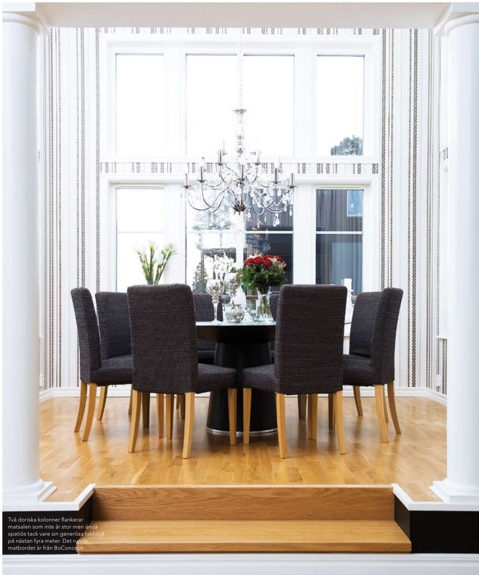
Två doriska kolonner flankerar matsalen som inte är stor men ändå spatiös tack vare sin generösa takhöjd på nästan fyra meter. Det runda matbordet är från BoConcept.