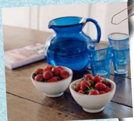
Sommarens godaste mellanmål: färska jordgubbar!

BÄST MED VÅRT SOMMARHEM: "Den öppna planlösningen i de sociala rummen – kök, matplats, vardagsrum – som gör det lätt att umgås, samt utsikten mot havet!"