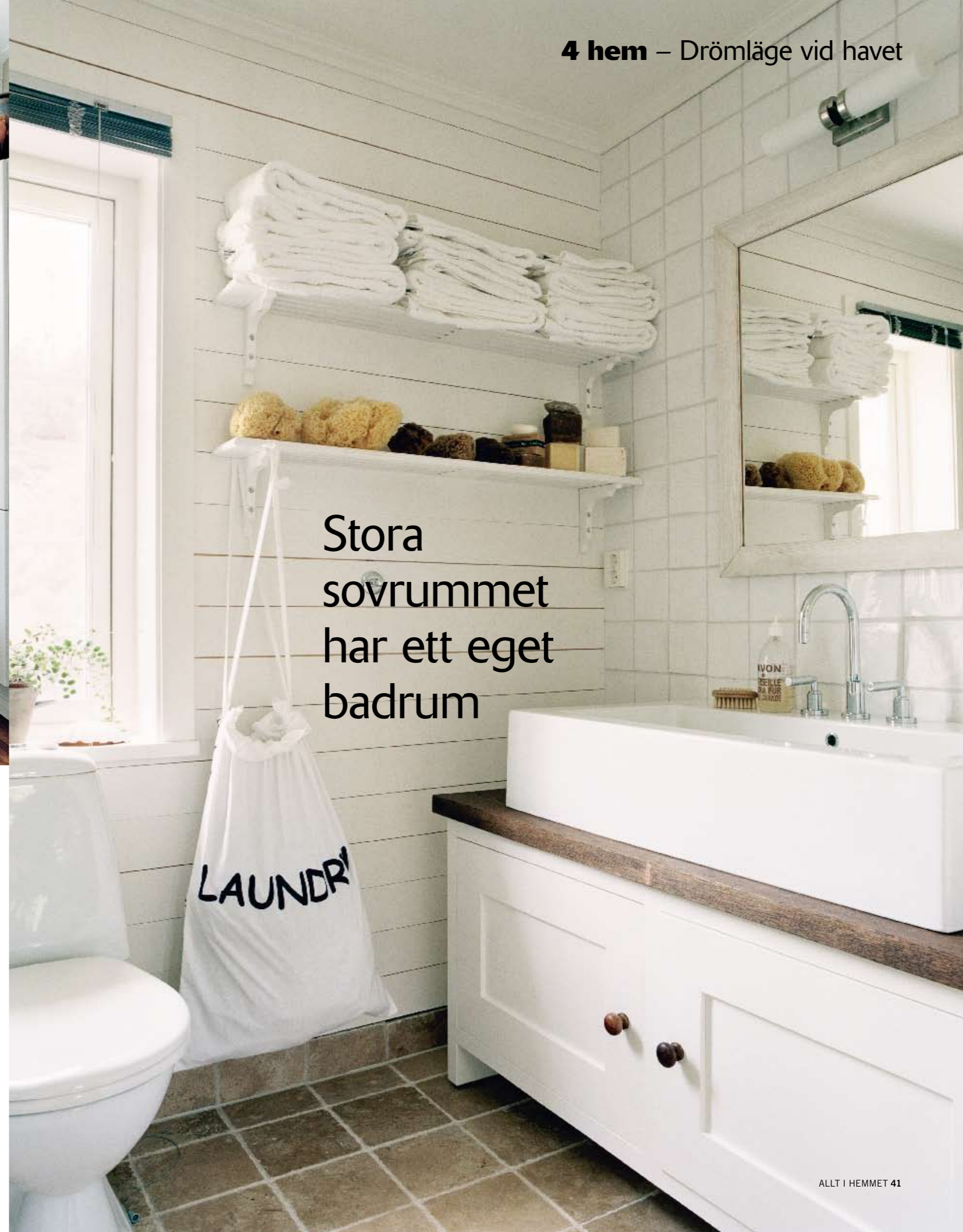
Stora sovrummet har ett eget badrum