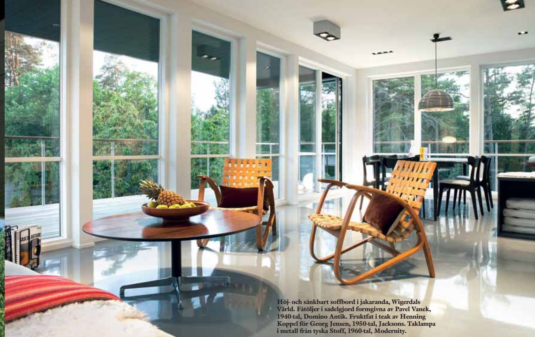
Höj- och sänkbart soffbord i jakaranda, Wigerdals Värld. Fåtöljer i sadelgjord formgivning av Pavel Vanek, 1940-tal, Domino Antik. Frukttfat i teak av Henning Koppel för Georg Jensen, 1950-tal, Jacksons. Taklampa i metall från tyska Stoff, 1960-tal, Modernity.

S å här års går trafiken tät från Stockholm mot Värmdö. Först flytande på flerflig motorväg genom Nacka men snart stånkande och avstannande på en allt äldre och slingrigare landsortsväg, på kustkanten av en skärgårdsidyll som spirar och knakar av överbefolkning på strandtomter, badplatser och marinor.