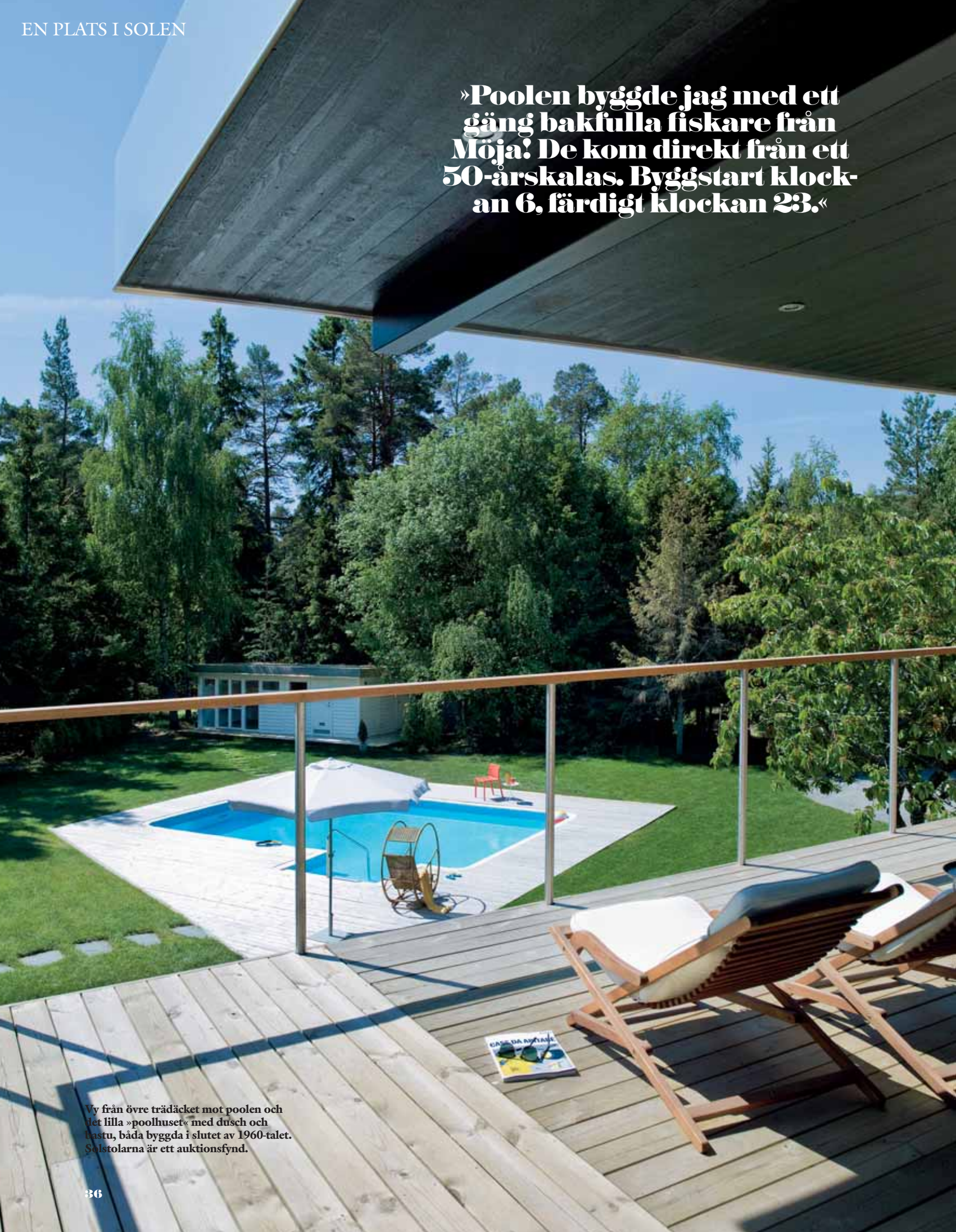
Vy från övre trädäcket mot poolen och det lilla »poolhuset« med dusch och bastu, båda byggda i slutet av 1960-talet. Solstolarna är ett auktionsfynd.

»Poolen byggde jag med ett gäng bakfulla fiskare från Möja! De kom direkt från ett 50-årskalas. Byggstart klockan 6, färdigt klockan 23.«